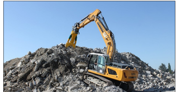
Aggregate, welche für das entwickelte Gerät verwendet werden können hydremag.ch