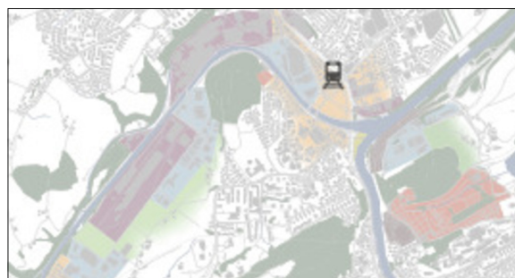
Konzeptionelle Ideen für den Bearbeitungsperimeter "Luzern Nord" eigene Darstellung, AV-Daten: Kanton Luzern