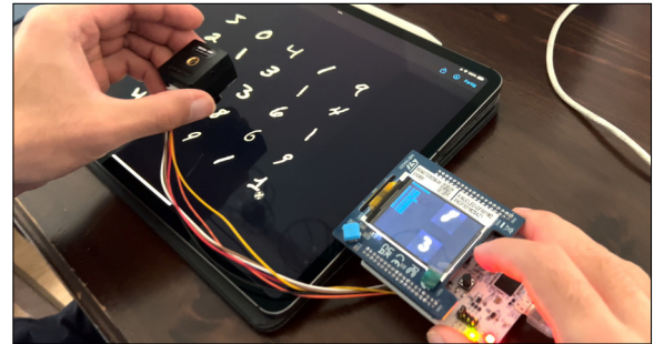
Positive Korrelation von Komplexität (MACC) vs. Genauigkeit für je 8 CNN Modelle (Anmerkung: int8 Modelle komplexer). Eigene Darstellung

Ergebnis: Die Benchmarks der trainierten Modelle konnten auf der MCU bei unterschiedlicher Quantisierung durchgeführt und der Demonstrator konnte erfolgreich implementiert werden. Wie erwartet erkennt der Demonstrator Ziffern mit einem CNN besser als mit einem FCNN. Die Ergebnisse der Benchmarks zeigten eine positive Korrelation zwischen Speicherbedarf und Genauigkeit. Ein ähnlicher Zusammenhang konnte zwischen MACC und Genauigkeit festgestellt werden. Der Demonstrator mit implementiertem CNN erkennt die Ziffern des MNIST-Datensatzes. Eigene Darstellung