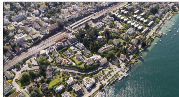
Gemeinde Thalwil, Bahnhof inkl. Seeufer www.energie360.ch

Um die Umsetzungen der IE-Strategie voranzutreiben soll zudem ein Delegierter in der Gemeindeverwaltung bestimmt werden. Dieser hat den Auftrag durch Information und Kommunikation eine Verdichtung innerhalb des Gemeindegebiets vorantreiben. Die einzelnen Teilprojekte unterscheiden sich aufgrund ihrer Parzellenstrukturen und Stossrichtungen.