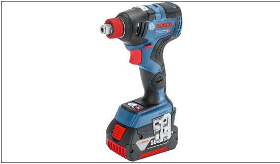
Bosch Tangential-Schlagschrauber www.bosch-professional.com/ch/it/products/gds-18v-200-c-0601

Ausgangslage: Der Tangential-Schlagschrauber ist ein Bohrschrauber, mit dem sich Gewindeverbindungen deutlich leichter anziehen lassen als mit herkömmlichen Methoden. In Zukunft werden die Tangential-Schlagschrauber zum kontrollierten Anziehen von Schraubverbindungen eingesetzt. Kontrolliertes Verschrauben bedeutet, dass jede Art von Schraubverbindung und die dazugehörige Schraube ihre eigenen Parameter haben, die beachtet werden müssen, um einen optimalen Anzug zu erreichen. Zu diesen Parametern gehören die Vorspannkraft und das Drehmoment, unter dem die Verbindung belastet wird. Diese Parameter werden heute noch mit Drehmomentschlüsseln, Torsionsstäben, Abschalt-Steuerungen usw. überprüft.