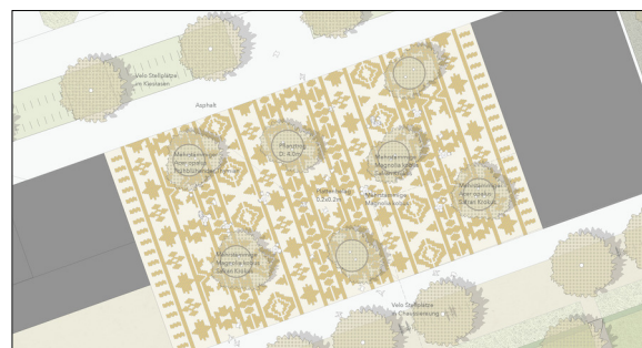
Vorprojektplan der neu verdichteten Wydesiedlung. Die Freiraumgestaltung orientiert sich am gartenkulturellen Erbe. Eigene Darstellung