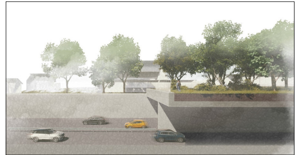
Schnittansicht durch das Überdeckungsbauwerk, Erholungsraum über der Autobahn Eigene Darstellung