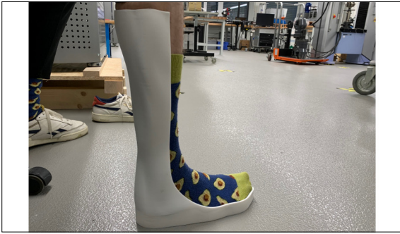
Grundschale am Fuss getragen

Einleitung: Aufgrund einer Durchblutungsstörung leiden Diabetikerinnen und Diabetiker oft unter einem gestörten Schmerzempfinden. Dies führt meistens zu lange unentdeckten Verletzungen an den Füßen. Eine Unterschenkel Fussorthese kann dabei die Heilung unterstützen und den Patientinnen und Patienten dennoch eine gewisse Bewegungsfreiheit ermöglichen. Im Rahmen dieser Bachelorarbeit sollen Grundlagen zur Herstellung einer Unterschenkel Fussorthese mittels SLS (Selektivem Lasersintern) erarbeitet werden. Da eine Orthese immer eine Einzelanfertigung ist, wird mittels 3D-Scan und Remodeling des Fusses eine individuelle Schiene erstellt und getestet.