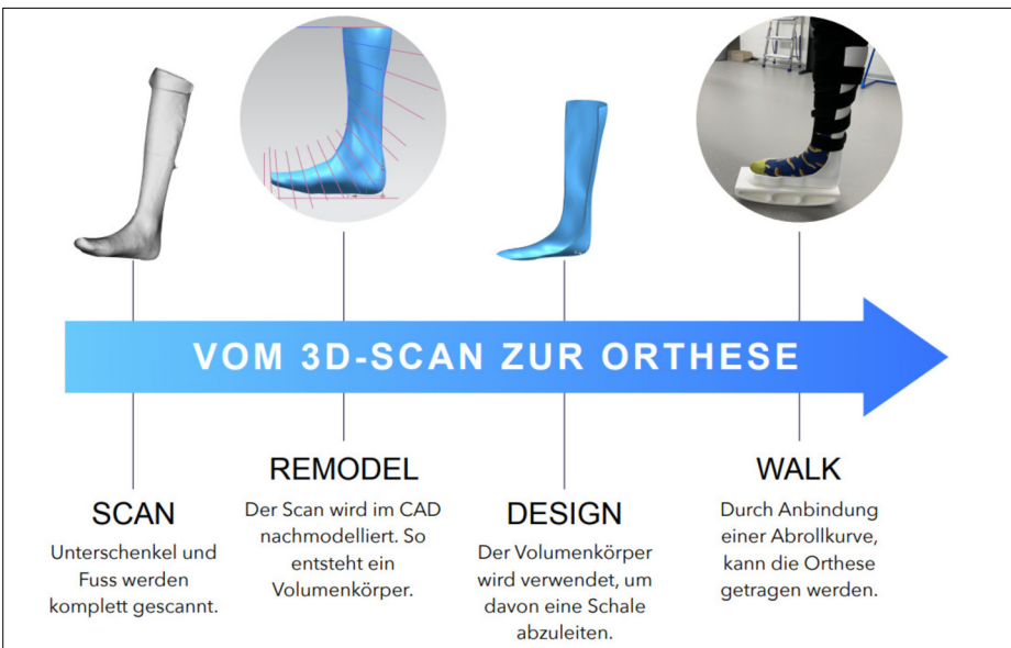
Prozess; Vom 3D-Scan zur Orthese Eigene Darstellung