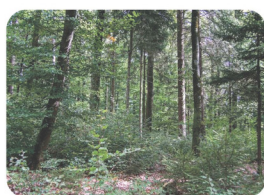
Naturschutzgebiet in der Gemeinde Seon