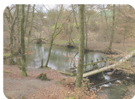
Industriellen Zeitzeugen am Aabach