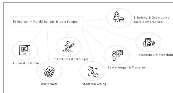
Abb. 2 Übersicht der Handlungsfelder und dessen Bezug zu den Entwicklungszielen und Synergien. Eigene Darstellung